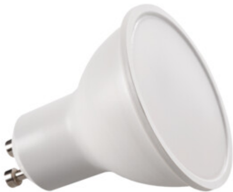
TOMIv2 6,5W GU10