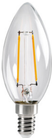
XLED C35E14 2,5W