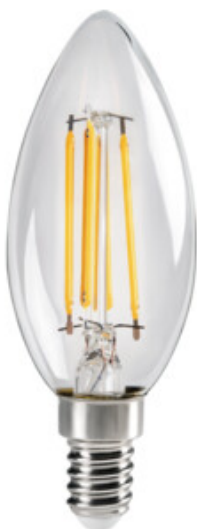
XLED C35E14 4,5W