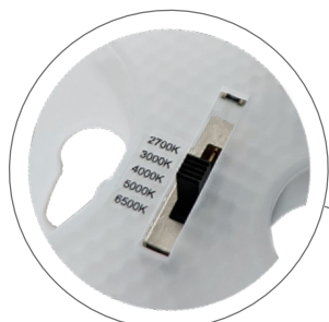
• detail přepínače