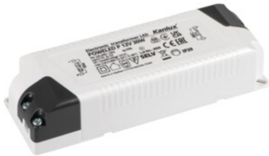
POWELED P 12V 30W