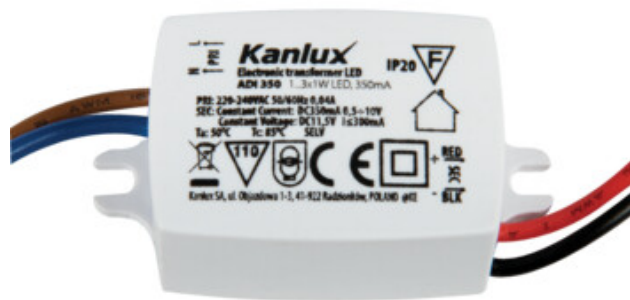
ADI 350 1x3W